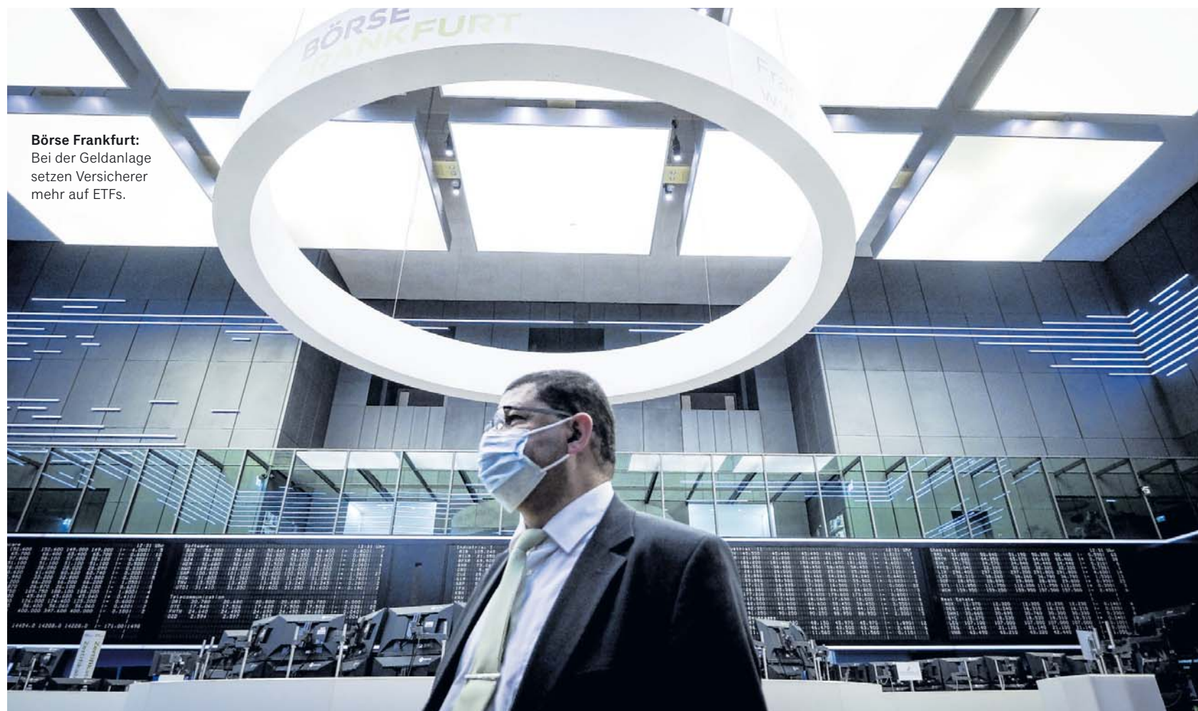
Börse Frankfurt: Bei der Geldanlage setzen Versicherer mehr auf ETFs.